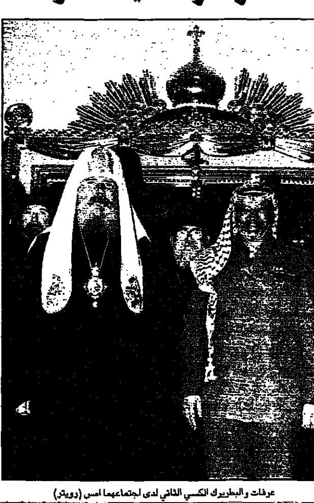
عرفات والبطريرك الكسي الثاني لدى اجتماعهما امس

موسكو - اف ب: اعلن رئيس السلطة الفلسطينية ياسر عرفات امس سعيه لزيارة البطريرك الكسي الثاني في بيت لحم. وقال المتحدث ان البطريرك الكسي الثاني دعا عرفات لزيارة بيت لحم.